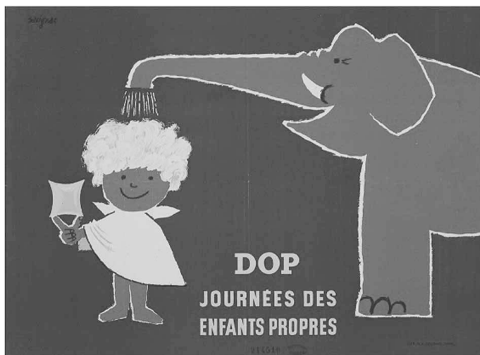
《ドップ:清潔な子どもの日》1954年 パリ市フォルネー図書館蔵 ©Annie Charpentier 2018