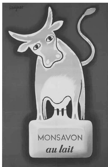
《牛乳石鹸モンサヴオン》1948/50年 パリ市フォルネー図書館蔵 ©Annie Charpentier 2018